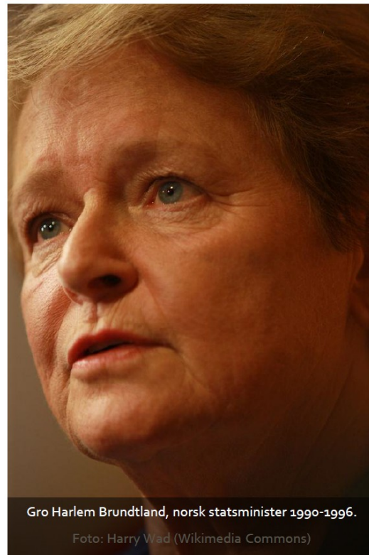
Gro Harlem Brundtland, norsk statsminister 1990-1996.